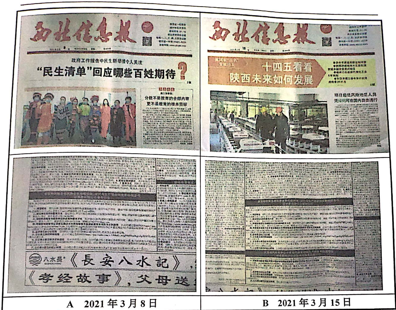
图3 拟建项目环境影响评价信息报纸公示